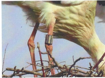
25.2.26, Eindeutig «Biel» A5628 (BHu)

Noch ist es etwas früh für definitive Aussagen. Viele Störche, die im Winter weggezogen sind, sind noch nicht aus dem Süden zurück. Es kann also durchaus sein, dass der (vielleicht) noch vermisste Partner noch eintrifft und sich mit einem allfälligen neuen Partner um den Horst und seine Partnerin streitet.