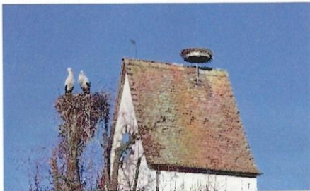
25.2.26, Beat Huggenberger (BHu)

Unvermittelt und völlig überraschend konnten wir ab 13.02.2026 beobachten wie unser langjähriges Storchchen-Brutpaar, Biel (DER A5628) und Partner Benken (nicht beringt) vom Kirchturm auf die im letzten Jahr massiv gestutzte Linde vor der Kirche umgezogen sind. Und dies nach 18 gemeinsamen Bruten auf dem Horst auf unserem Kirchturm. Was die beiden zum Umzug bewogen hat, lässt sich nicht sagen.